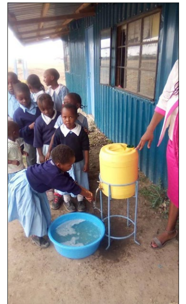
Kaputei Hauge Skole I Kadiado åpner etter ferie i august med demonstrasjon av hygiene med håndvask, i såpe og vann.